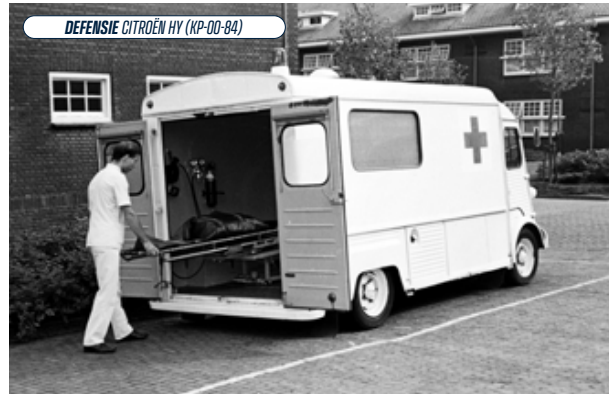
DEFENSIE CITROËN HY (KP-00-84)

▼ Koninklijke Marine, Marienevliegkamp Valkenburg Mercedes-Benz 310 (KM-55-06) 1984