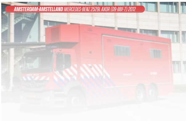
AMSTERDAM-AMSTELLAND MERCEDES-BENZ 2529L AXOR (09-BBF-7) 2012

◀ In samenwerking met Koning&Hartmann bouwde Akkermans in 1994 in opdracht van het ministerie van Binnenlandse Zaken op een Mercedes-Benz 814 Ecoliner-chassis een prototype voor de 2 e generatie VC-I. In 1995 werd de opbouw overgezet op een Mercedes-Benz 917 Ecoliner-chassis. (BB-PL33)