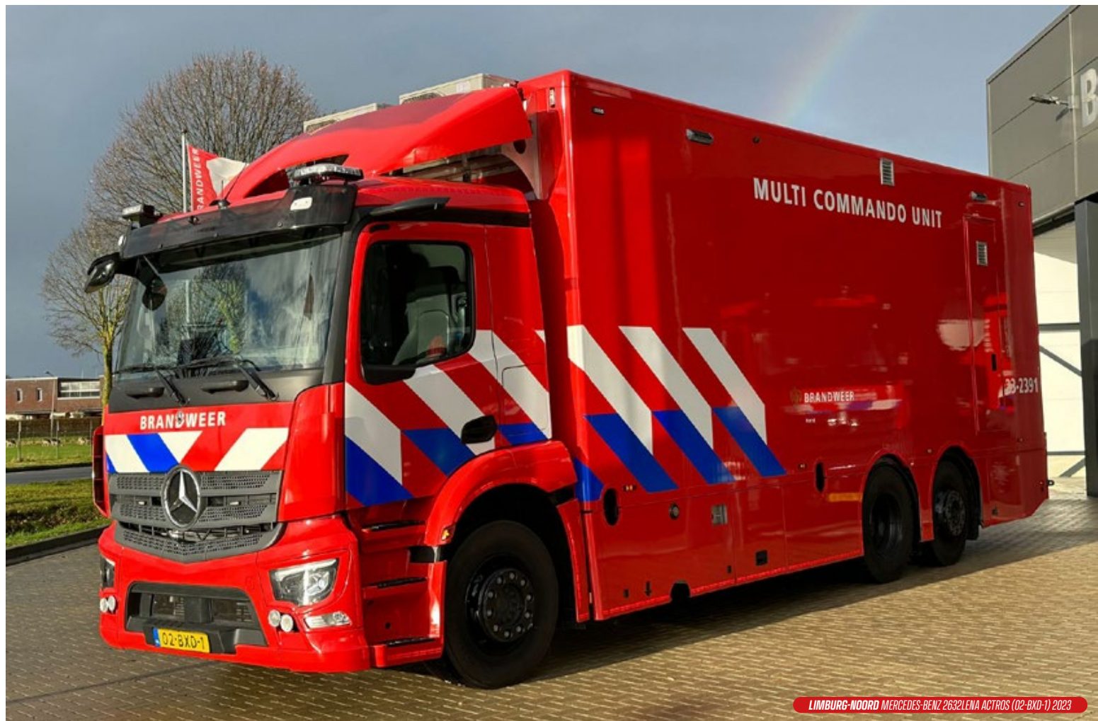
LIMBURG-NOORD MERCEDES-BENZ 2632LENA ACTROS (02-BXD-1) 2023