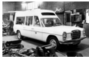
◀▲ De vroegere werkplaats van Akkermans in Oud-Gastel