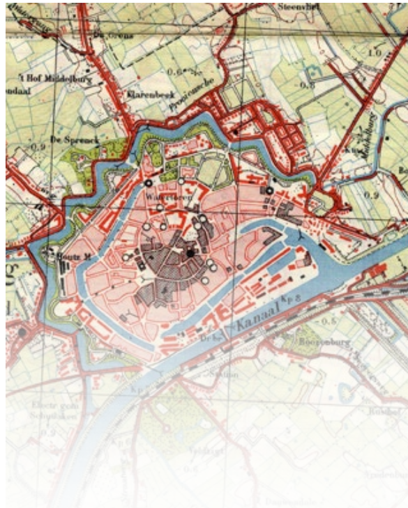
Duitse topografische kaart van Middelburg. Het door het bombardement van 14 mei verwoeste gedeelte is zwart gearceerd. Bevrijdingsmuseum, Nieuwland

Na die vrijdag (ook wel Zwarte Vrijdag genoemd) kan de balans worden opgemaakt. Middelburg telde volgens sommige bronnen elf volgens andere "gelukkig maar" twintig doden. Dat zijn er weliswaar tussen de tien en de twintig teveel, maar gezien de enorme verwoesting hadden dat er wel meer kunnen zijn.